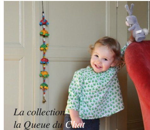
La collection la Queue du Chat

associations en France (CAT) ou au Burkina Fasso. Offrant ainsi à des dizaines de personnes, quelquefois handicapés, l'occasion d'apprendre un savoir faire et de travailler dans la dignité.